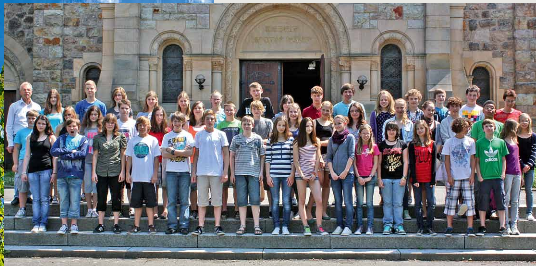
Konfirmanden und Konfirmandinnen 2010/2011

Kindergarten Schatzinsel Nördliche Hauptstraße 71 69469 Weinheim Fon 6 36 76, Fax 604 92 61 kiga.schatzinsel@kblw.de