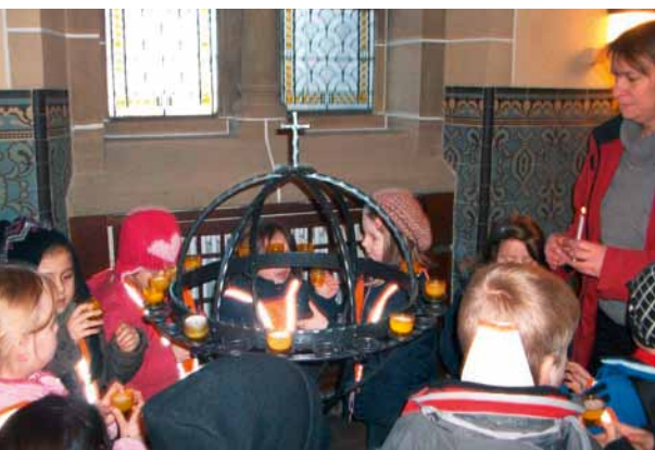
Schulanfänger in der Peterskirche