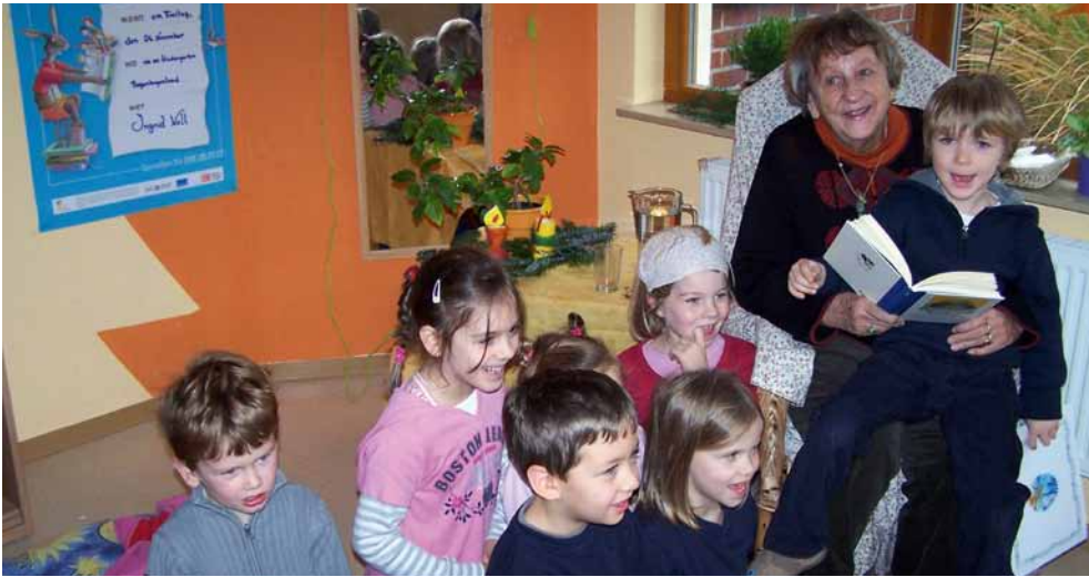
Ingrid Noll zu Besuch im „Regenbogenland“