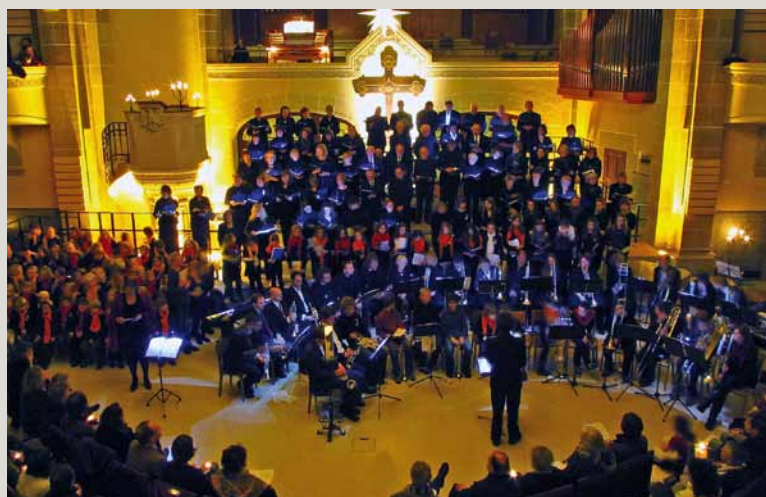
Weihnachtskonzert bei Kerzenschein