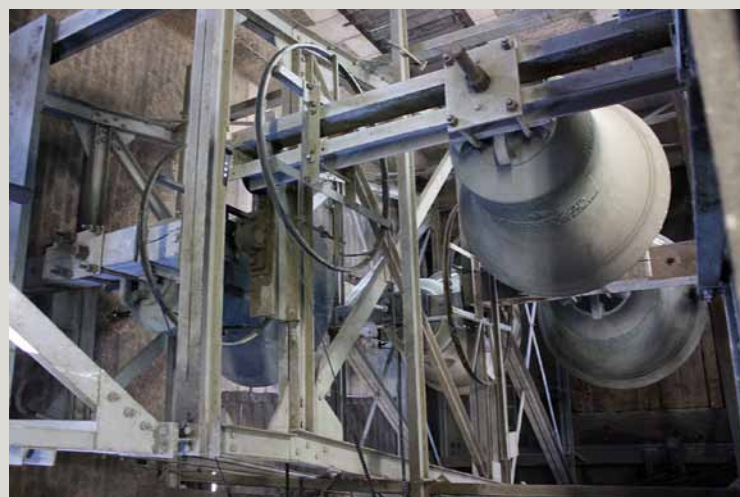
Glockenstuhl der Peterskirche