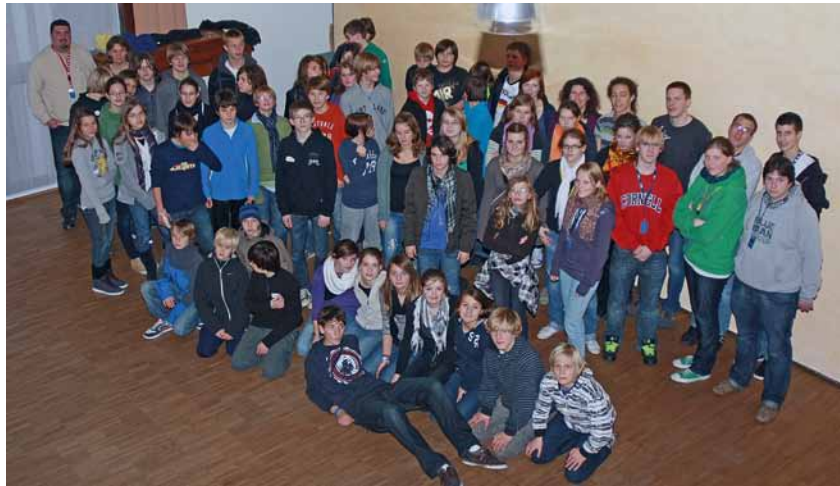
Teilnehmer der Churchnight

Wenn Sie Fragen oder Anmerkungen haben, können Sie sich gerne an Webmaster Ulli Naefken wenden ( www.ulnastudios.com ).