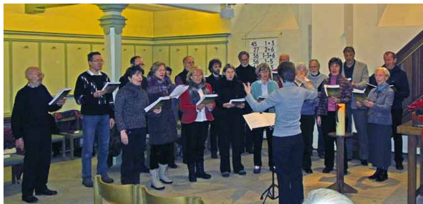
Die Kantorei am 2. Christtag in der Stadtkirche

Lassen Sie sich zur ersten dieser Gottesdienst-Begegnungen einladen: Sonntag, 20. Februar, Beginn 10.00 Uhr.