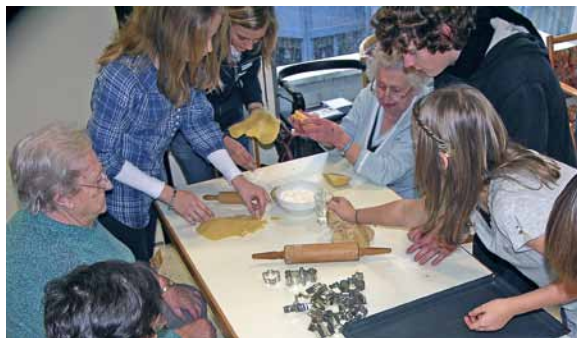
Konfis zu Besuch im Bodelschwingheim