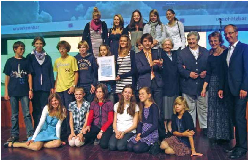
Bei der Siegerehrung

In diesem Jahr haben wir das sogenannte „Kirchgeld“ zugunsten der Chöre an der Peterskirche gesammelt. Herzlichen Dank allen, die bisher dafür gespendet haben!! Bis zum Redaktionsschluss am 28.10. sind bereits 4500,-€ zusammengekommen!