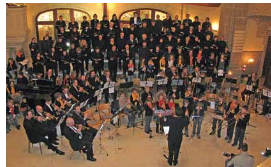
Konzert bei Kerzenschein