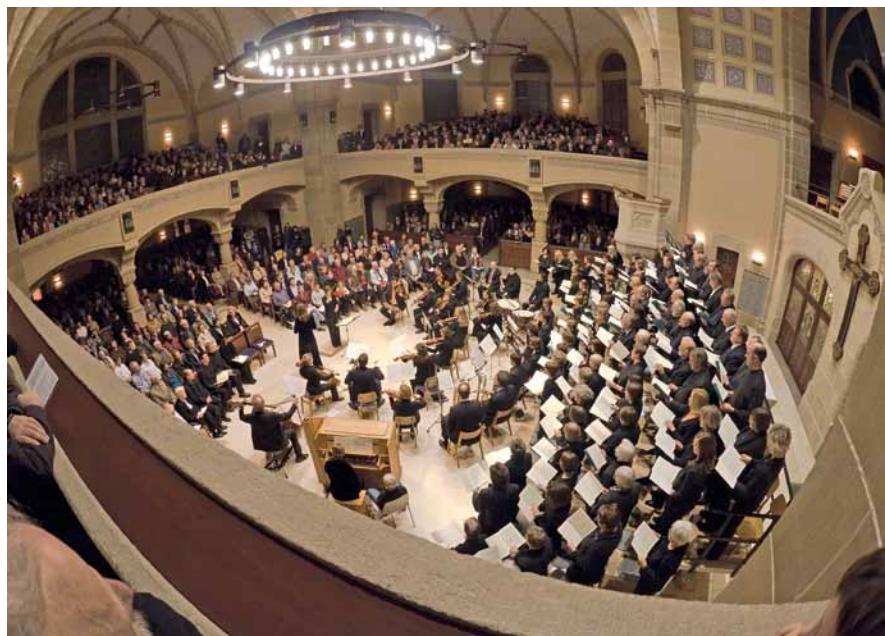
Mozarts „Requiem“ in der Peterskirche