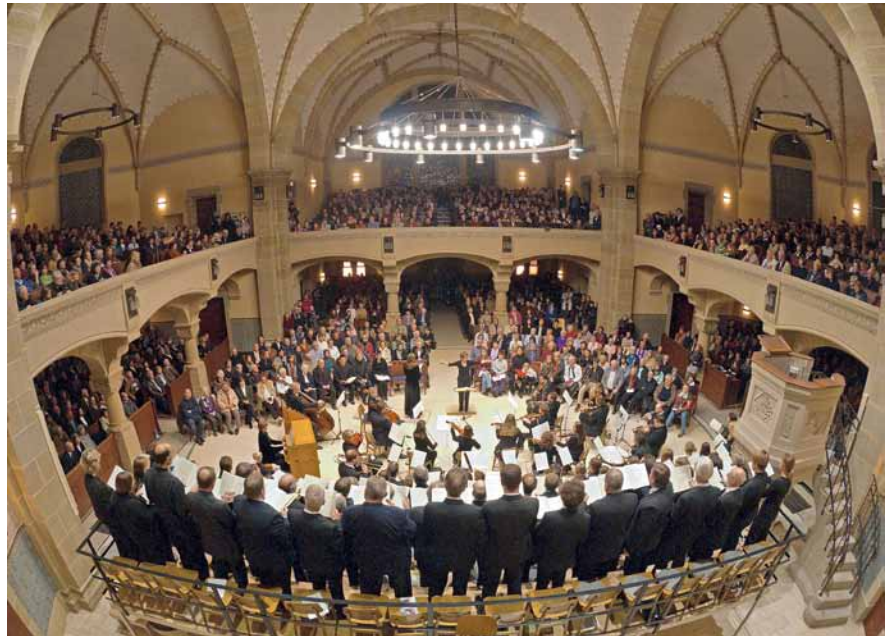
Mozarts „Requiem“ in der Peterskirche