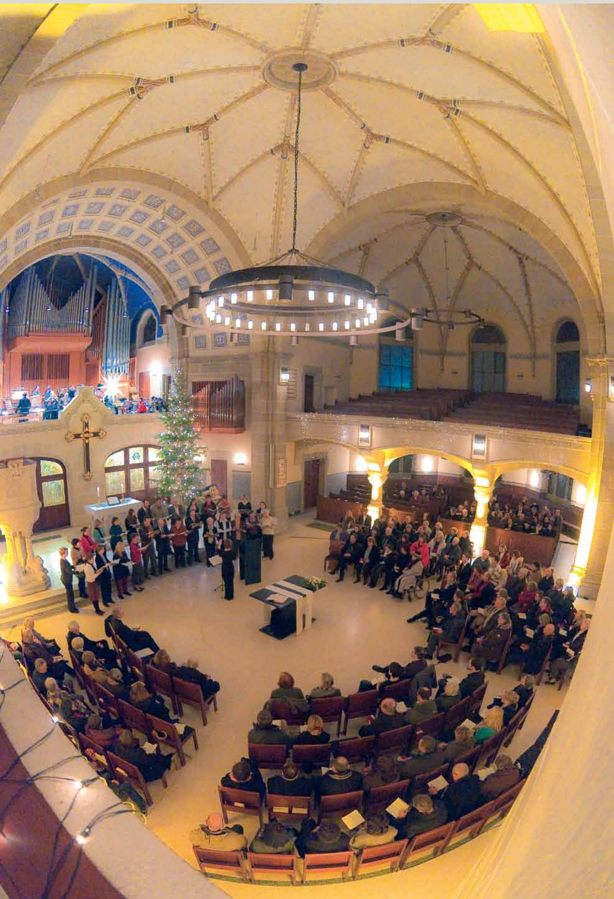
Christmette in der Peterskirche