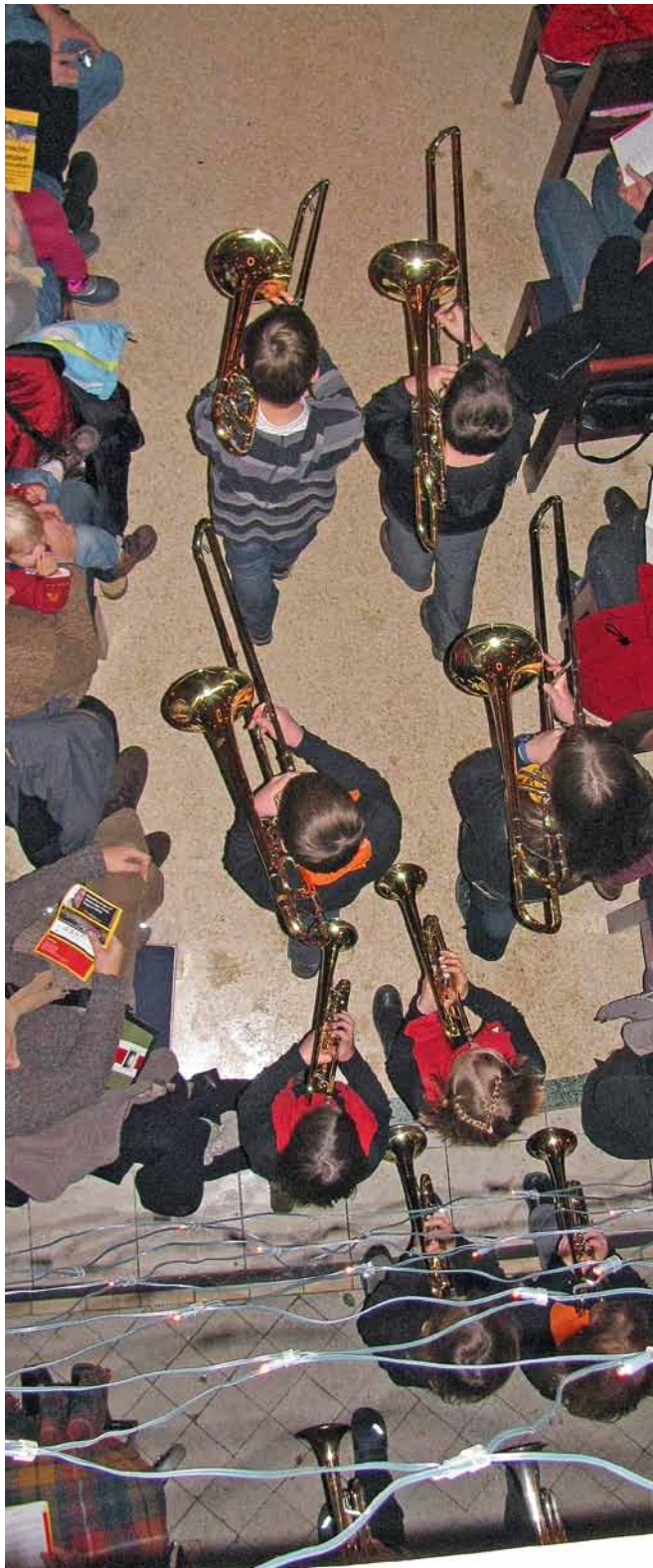
Konzert bei Kerzenschein