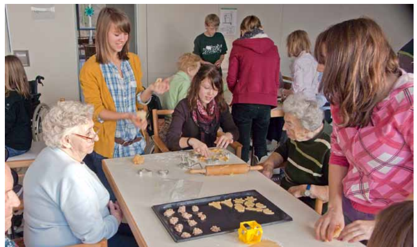
Backen mit Konfis im Bodelschwingh-Heim