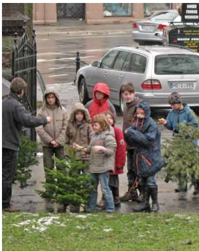
1. Weinheimer Weihnachtsbaumweitwerfen

Im Grund- und Aufbaukurs, die jeweils einige Wochenenden umfassen, werden Gemeindeglieder, die vom Bezirkskirchenrat dazu vorgeschlagen wurden, dazu ausgebildet, Gottesdienste zu leiten. Nach Beendigung ihrer Ausbildung und der offiziellen Berufung können Prädikanten innerhalb ihres Kirchenbezirkes für Gottesdienste angefragt werden.