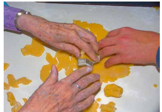
Backen mit Konfis im Bodelschwingh-Heim

Anmeldungen nimmt Bärbel Deacu, Bodelschwingh Ambulanter Pflegedienst, unter 06201/182564 entgegen.