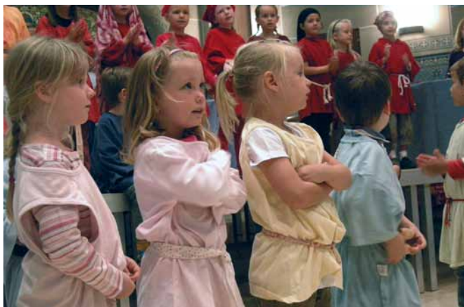
Gerempel im Tempel