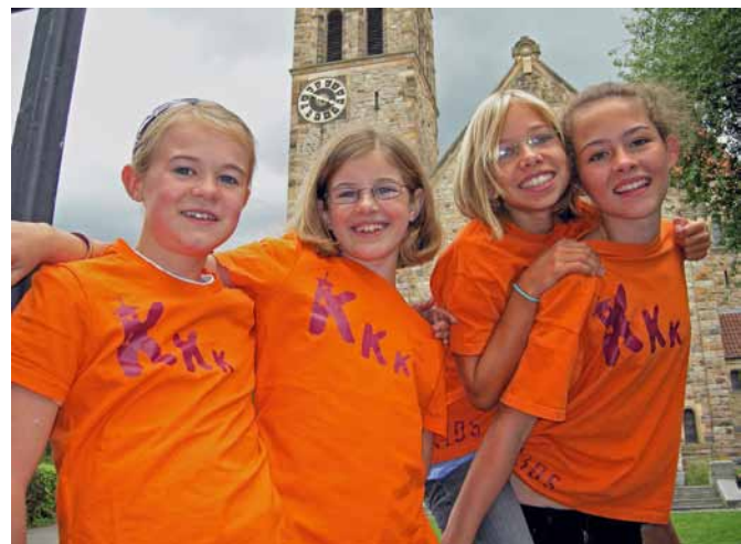
Bühne frei für die Kirchenkellerkids

Die Aufführungen sind am 17. und 18. Oktober 2009, 18.00 Uhr in der Weinheimer Peterskirche, Eintritt 5.- / 3.- Euro