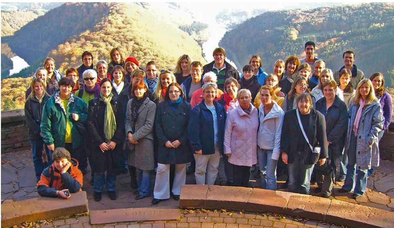
Betriebsausflug der Evangelischen Kirchengemeinde

Karlsruhe. „Ab dem nächsten Haushalt sollen Landeskirchen und Diözesen ein Prozent zusätzlich zu den bestehenden Programmen für Umweltschutzmaßnahmen ausgeben“. So lautet eines der Ziele, die das bundesweite ökumenische Netzwerk Kirchliches Umweltmanagement (KirUm) in den nächsten Jahren erreichen will. Rund 130 Vertreter aus Kirchengemeinden, kirchlichen Einrichtungen, Organisationen und Verwaltungen aus ganz Deutschland trafen sich am 24./25. Oktober im Evangelischen Oberkirchenrat in Karlsruhe, um die Ziele und Perspektiven für das KirUm-Netzwerk bis 2012 zu erarbeiten.