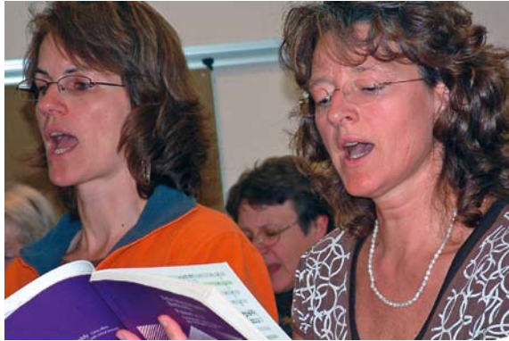
Proben für „Paulus“