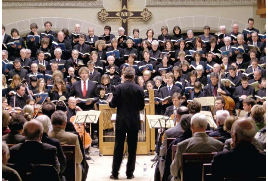
Matthäus-Passion in der Peterskirche

Das Konzert beginnt um 16.00 Uhr in der Peterskirche, der Eintritt ist frei.