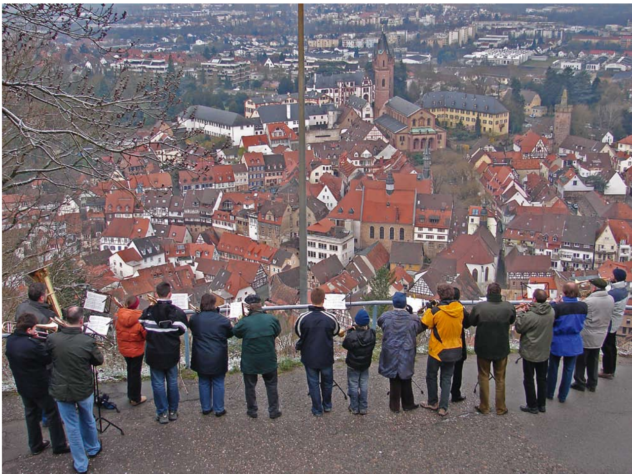
Bläser auf der Burgruine Windeck am Ostermorgen