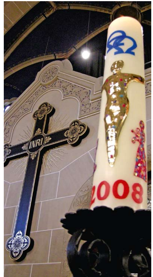
Unsere neue Osterkerze