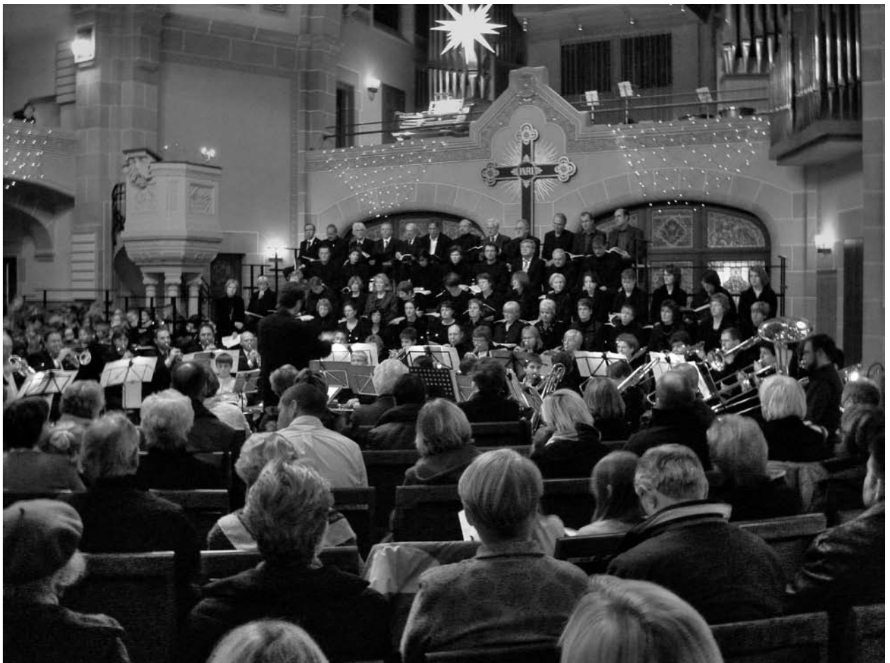
Konzert bei Kerzenschein

Die „goldenen“ und „diamantenen“ Konfirmandinnen und Konfirmanden der Konfirmationsjahrgänge 1958 und 1948 feiern dieses Jahr die Jubelkonfirmation am 2. März (Sonntag Lätare) um 10.00 Uhr in der Peterskirche. Am Nachmittag sind die Jubilarinnen und Jubilare ab 15.00 Uhr zum Begegnungsnachmittag bei Kaffee und Kuchen ins Martin-Luther-Haus eingeladen. Gemeindeglieder, die vor 65, 70 oder 75 Jahren konfirmiert wurden sind ebenfalls zur Feier eingeladen. Bitte melden Sie sich im Pfarramt in der Scheffelstr. 4, Tel. 12676 bis zum 20. Februar 2008 an. Die Gemeinde an der Peterskirche freut sich auf die Begegnung mit Ihnen.