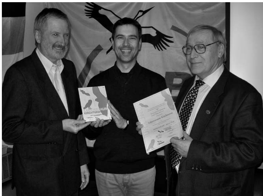
Wir bieten Turmfalken einen „Lebensraum Kirchturm“

In unserem Martin-Luther-Haus ist der Weinheimer Mittagstisch von 4. bis 9. Februar 2008 zu Gast. Seinen Abschluss findet er dann am 1. März 2008 mit einem Abschlussgottesdienst um 14 Uhr in der Stadtkirche am Marktplatz.