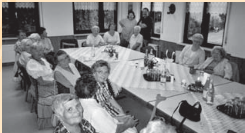
Frauenkreis der Paulusgemeinde in Rippenweier

Anmeldungen bitte über das Pfarramt der Paulusgemeinde Telefon: 06201/12676.