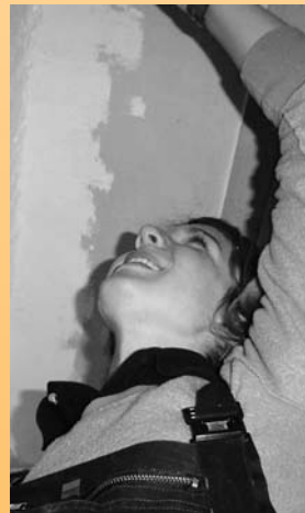
72 Stunden ohne Kompromiss

(uLNa) „Rund um den Nikolaus“ geht es beim Familiengottesdienst am 5. Dezember um 10 Uhr in unserer Peterskirche. Gestaltet wird der Gottesdienst vom Kindergarten Schatzinsel. Für das anschließende Mittagessen im Martin-Luther-Haus sorgt schließlich der Kindergarten Regenbogenland. Herzliche Einladung an alle Gemeindeglieder, ob jung oder alt.