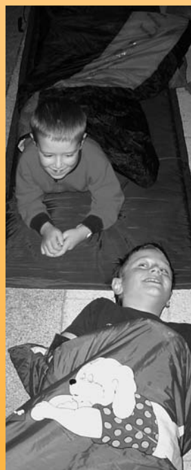
Übernachten in der Peterskirche