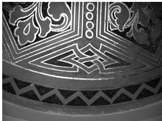
:: „Spannende Entdeckungen“

Am meisten freut sich ein Architekt natürlich auf die Fertigstellung eines Projekts. Da bin ich immer gespannt: Hat es funktioniert, was du dir vorgenommen hast? Wie ist die Resonanz? Springt der Funke der Begeisterung über? Bis dahin bleibt es ungeheuer spannend. Inzwischen freue ich mich über die guten Erfahrungen auf der Baustelle. Da sind wirklich einige gute Leute zusammen. Es macht Freude, zu sehen, mit wie guter Handwerklichkeit gearbeitet wird.