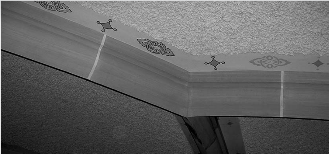
:: „Spannende Entdeckungen“