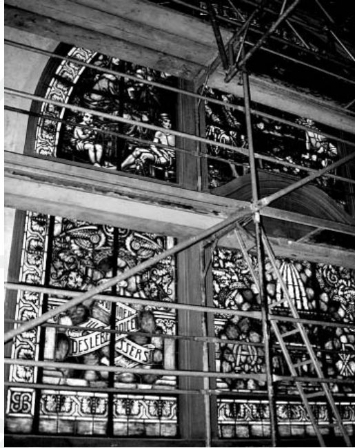
:: Auf der Baustelle