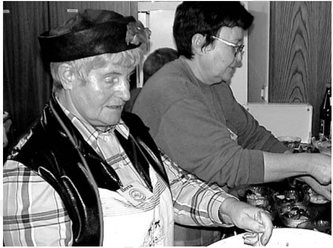
:: Weinheimer Mittagstisch