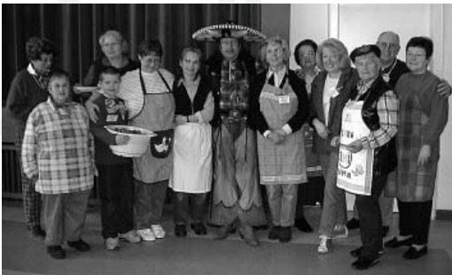
:: Weinheimer Mittagstisch