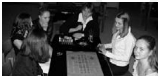
:: Im Casino

(uLNq) Am 20. März gibt es erstmals einen Tag der offenen Tür der Kindertageseinrichtungen der Evang. Kirchengemeinde Weinheim. Werfen Sie einmal einen Blick in bisher unbekannte Einrichtungen unserer Kirchengemeinde. Weitere Informationen zu den „Evangelischen Kindergärten in Weinheim“ finden Sie ab Seite 16 dieser Ausgabe.