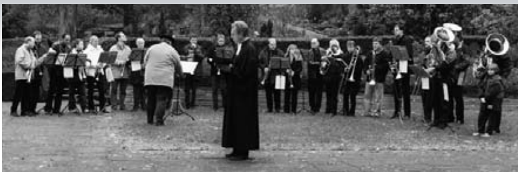
:: Ewigkeitssonntag auf dem Friedhof