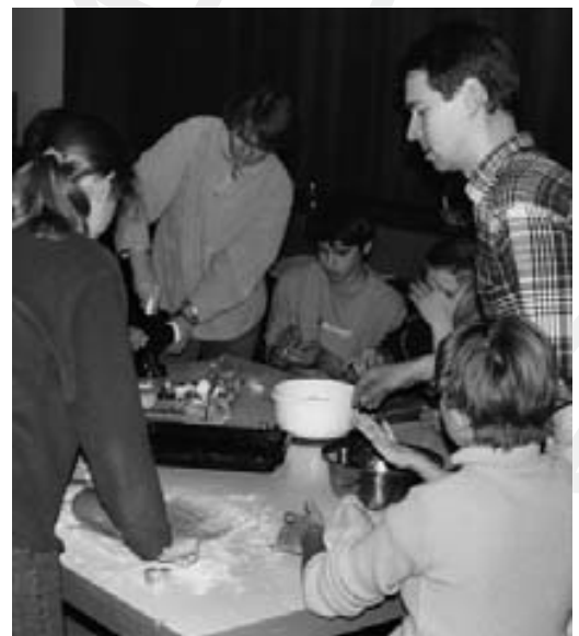
:: Plätzchen backen für "Brot für die Welt"

Durch die Arbeiten an der Uhr wird diese sich gelegentlich verstellen.)