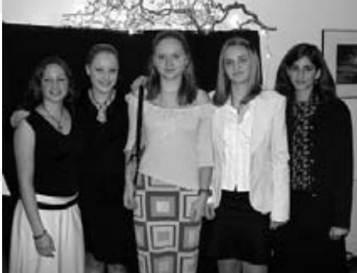
:: Im Casino