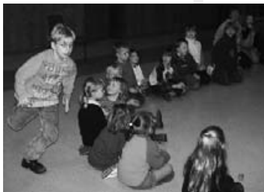
:: Adventsfeier der Jungscharen