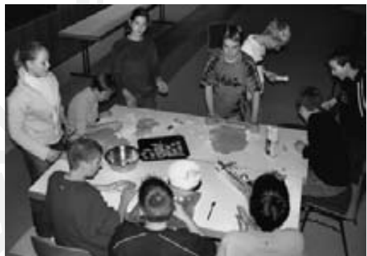
:: Plätzchen backen für "Brot für die Welt"