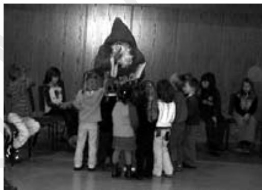
:: Adventsfeier der Jungscharen