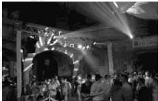
:: One Night Dance @ Saint Peters