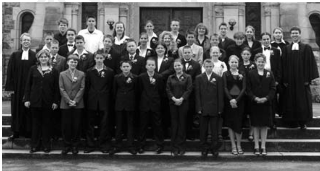
Unsere Konfirmierten 2003