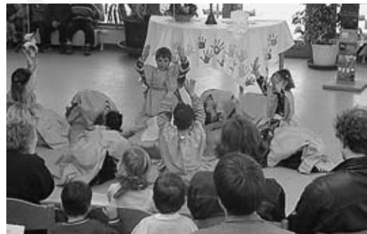
Tag der offenen Tür im Kindergarten „Pustblume“