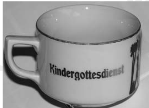
In welchem Jahr gab es diese Kindergottesdienst-Tasse?