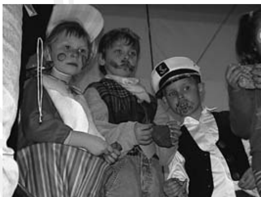
Ausblick: Wir feiern 2x Fasching.