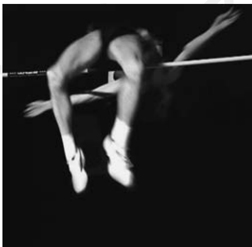
Fest im Blick: Mit uns steigt Weinheim hoch ...