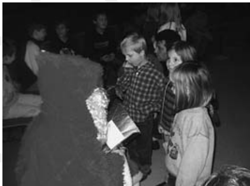
Rückblick: Adventsfeier der Jungscharen

Vieles werden wir im Laufe des Visitationsjahres hoffentlich erfahren. Lassen wir uns mal überraschen. Ich danke Ihnen für das Gespräch.