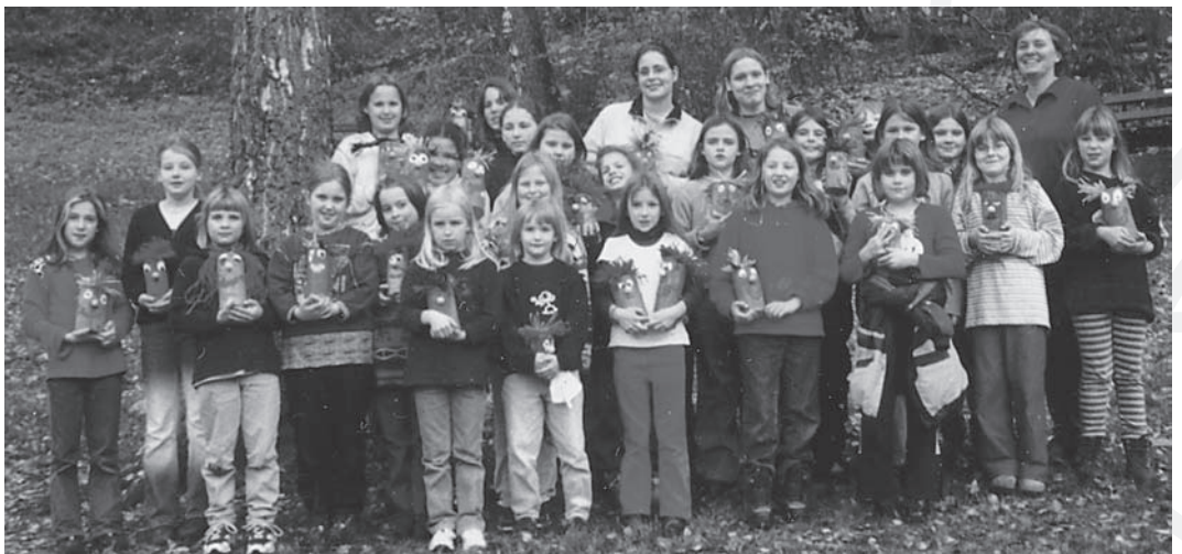
„Girls on tour“