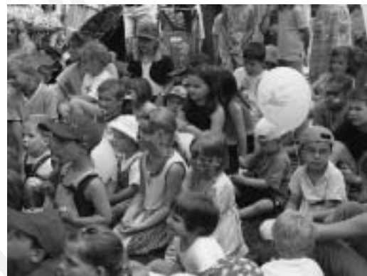
Auf dem Ökumenischen Kirchentag im Schlosspark