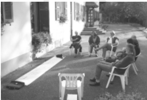
Ein Teil der gemeinsamen Arbeit wurde bei mildem Herbstwetter im Freien erledigt.

Bilanz und Ausblick standen im Mittelpunkt des Wochenendes vom 5. bis 7. Oktober 2001, das die Ältesten der Paulusgemeinde auf dem Liebfrauenberg im Elsass verbrachten. Dabei wurde die gemeinsame Arbeit der vergangenen 6 Jahre ausgewertet, Defizite der Gemeindegemeinschaft wurden ins Auge gefasst und zukünftige Projekte des Ältestenkreises geplant. Ein langer Spaziergang bot Gelegenheit zu ausführlichen persönlichen Gesprächen. Die Elsässer Küche rundete die angenehme Atmosphäre des gemeinsamen Wochenendes ab.